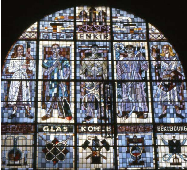
Nr. 1b ehem. Bahnhofsfenster