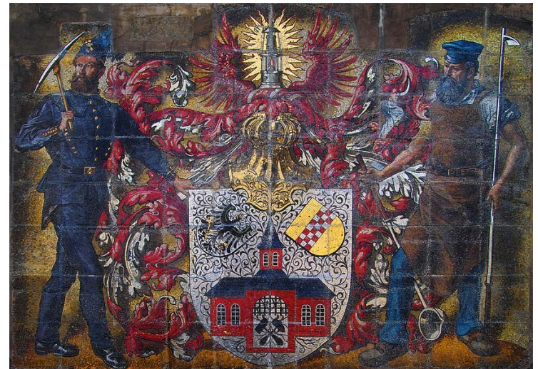
Nr. 1a altes Stadtwappen